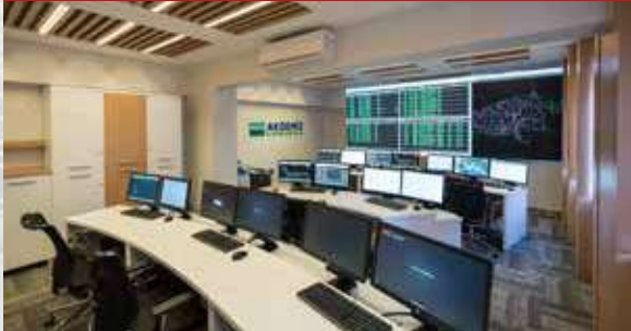
CLK Antalya-Sivas-Bursa Scada Merkezleri