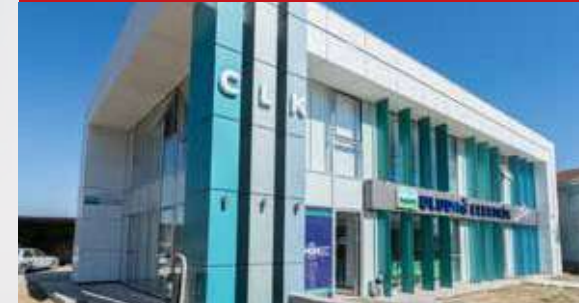
CLK UEDAŞ İnegöl Hizmet Binası