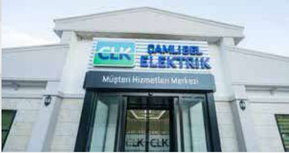
CLK Çamlıbel Mehmetpaşa Hizmet Binası