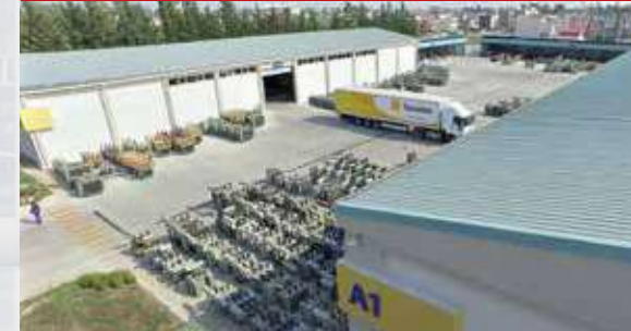
Enerjisa Adana Lojistik Hizmet Merkezi