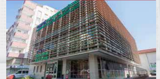
UEDAŞ Balıkesir İl Müdürlüğü Binası