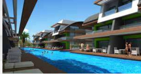
Antalya Marina Premium Villas