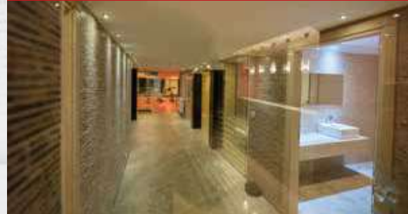
CLK ÇEPSAŞ Genel Müdürlük Misafirhane