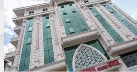
Sivas Revag Otel