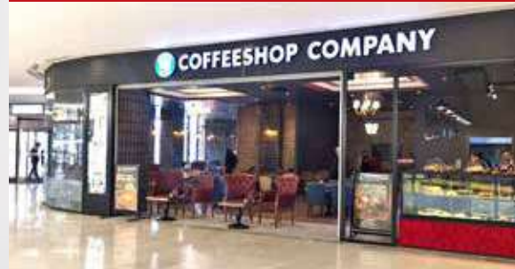
Coffee Shop Company - Prime Mall, Sivas