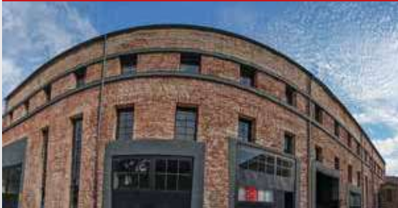
Başkent EDAŞ Sayaç Deposu