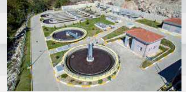
Dursunbey Atıksu Arıtma Tesisleri